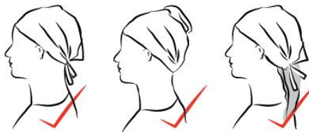
Whole head and hairline completely covered

Les turbans servent à retenir l'énergie à l'intérieur et sont excellents pour créer le focus méditatif au troisième œil, soit l'espace au centre des sourcils. Un autre bienfait du turban consiste dans le fait que cet enveloppement dans 5 à 7 épaisseurs de tissu couvre entièrement les tempes, ce qui prévient toute variation ou tout mouvement dans les différentes parties de la boîte crânienne.